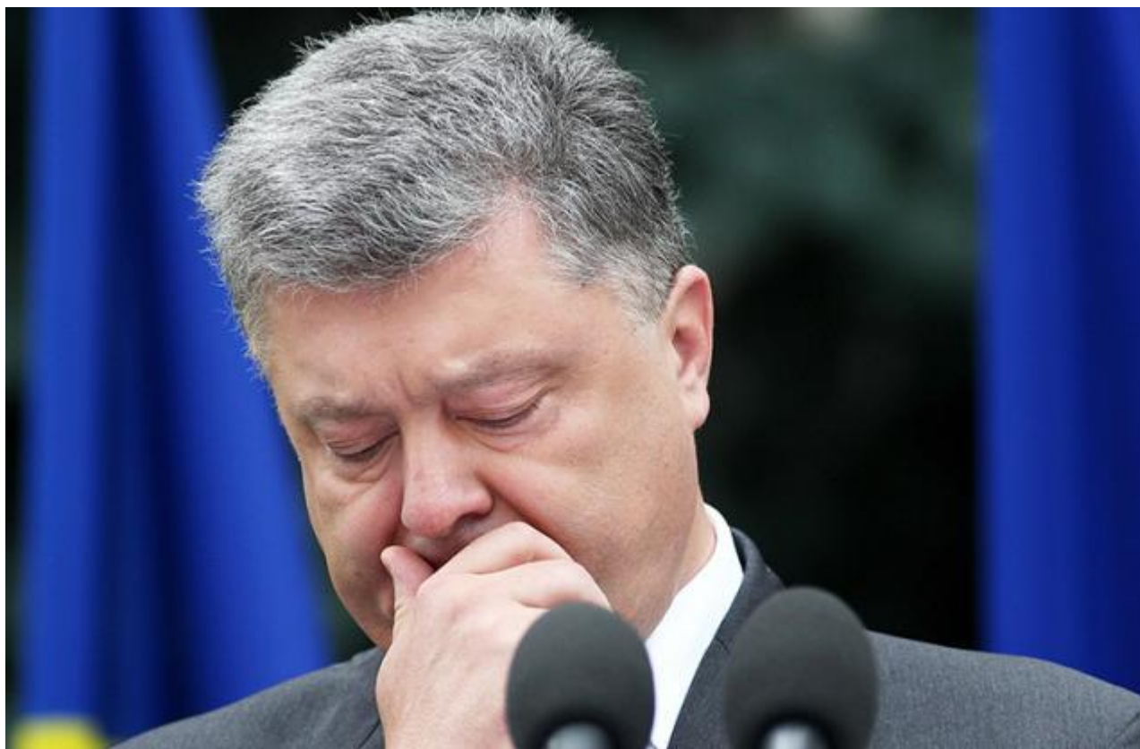
На фото: президент Украины Петр Порошенко

За последние несколько месяцев украинские социологические компании опубликовали множество результатов исследований электоральных настроений украинского общества. Президенту Украины Петру Порошенко они едва ли добавили оптимизма: согласно многим исследованиям, он имеет очень мало шансов не то, что переизбраться, а даже выйти во второй тур президентских выборов в следующем году.